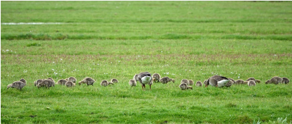
Bij dit paar Grauwe Gans lopen maar liefst 27 jonge gansjes (foto: 25 april 2023)

of er zijn hier een paar groepjes kuikens bij elkaar gekomen. Grauwe Ganzen vormen vaak crèches van tientallen kuikens die bewaakt worden door vele adulte vogels. De 2 Nijlganzen-paren hebben hun jongen (in totaal 6) tot nu toe ook goed kunnen behouden.