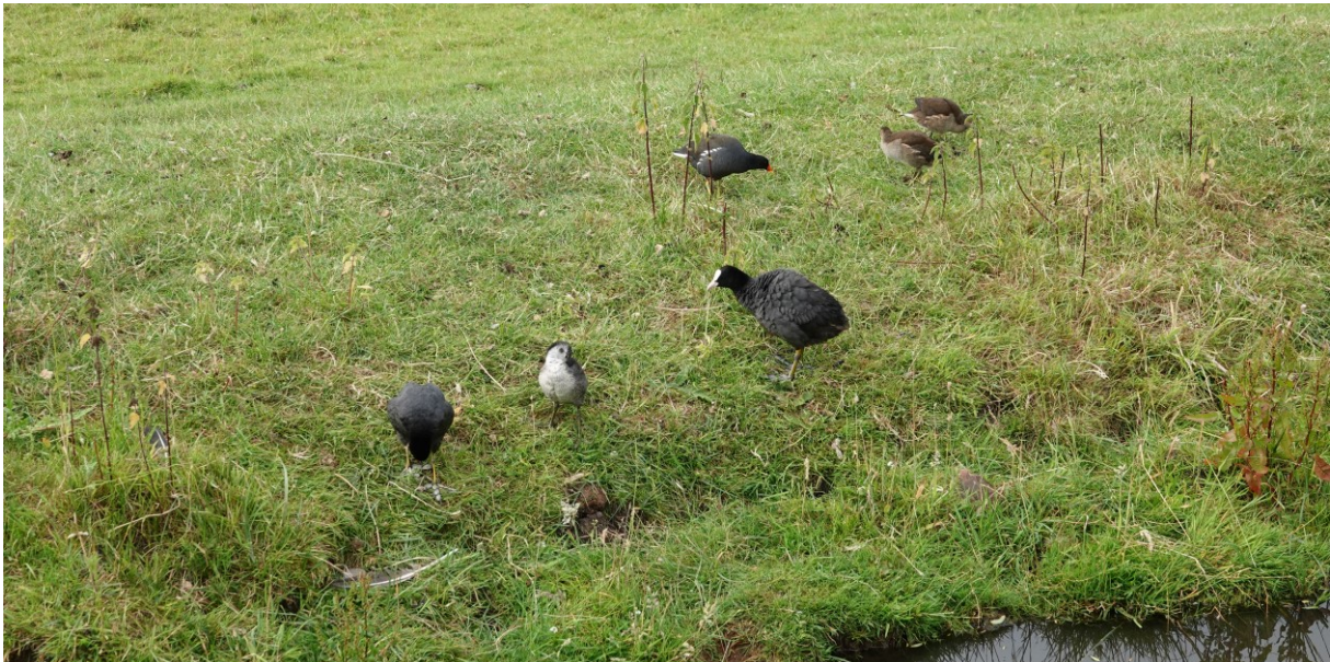
Waterhoen met jongen en Meerkoeten met jong (foto: 18 juni 2023)

Op 18 juni wordt melding gemaakt van Hommelbijvliegen en een Struiksprinkhaan in een tuin aan de Kadoelenweg. Deze dag, maar ook de dagen erna wordt veelvuldig het geluid van een roepende Koekoek gehoord. Er wordt een foto gedeeld van een bastaard wilde eend met opmerkelijk wit-bruin verenkleed. Op 19 juni wordt in de randsloot bij de Kadoelenweg een Waterhoen gezien met 3 kleine kuikens. In de randsloot langs Klein Kadoelen zwemt een Waterhoenen-paar met twee opgeschoten jongen. Ook een Meerkoeten-paar met een groot jong.