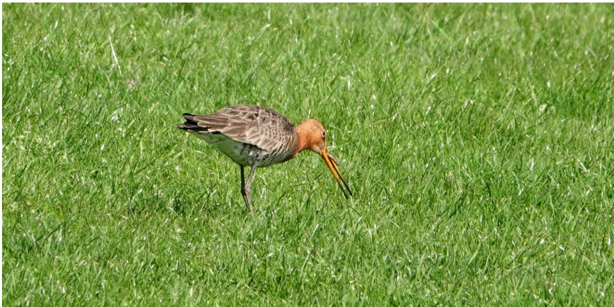
Grutto met larve in zijn snavel (foto: 25 april 2023)

Een paartje Grutto's lijkt een nest te gaan maken op perceel 'Gele Weidje'. Dit perceel heeft lange tijd blank gestaan vanwege een gebrekkige drainage. Nadat boer Harry een nieuwe geul naar de sloot had gegraven is het perceel een stuk droger geworden en begroeid geraakt met Duizendknoop. Dat Grutto-paar lijkt een mooie plek tussen de opschietende planten te hebben gevonden. In totaal tellen we vandaag 6 Grutto's; een mannetje Grutto foerageert op perceel 'Achterdijk' en is daar goed te fotograferen, zie onderstaande foto.