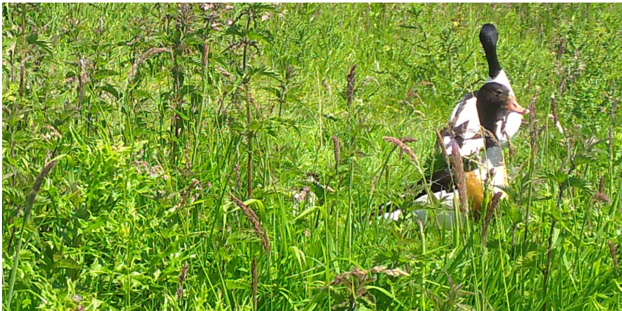
Bergeenden-paar met jonge kuikens in het hoge gras (foto: bewegingscamera, 3 juni 2023)

Enkele Bergeend-paren in de polder blijken, anders dan we vorige week dachten, toch in de afgelopen weken te hebben gebroed. Op een foto van de bewegingscamera bij perceel 'Stuk Achterhuis' staat een Bergeendenpaar met, verscholen in het hoge gras, enkele jonge kuikens. De foto is van 3 juni; op die foto (zie hieronder) is één kuiken te zien. Op een andere foto staan twee kuiken-kopjes. Vandaag, twee weken later, zien we bij perceel 'Stuk Achterhuis' dit Bergeenden-paar terug. Er blijken drie kuikens te zijn.