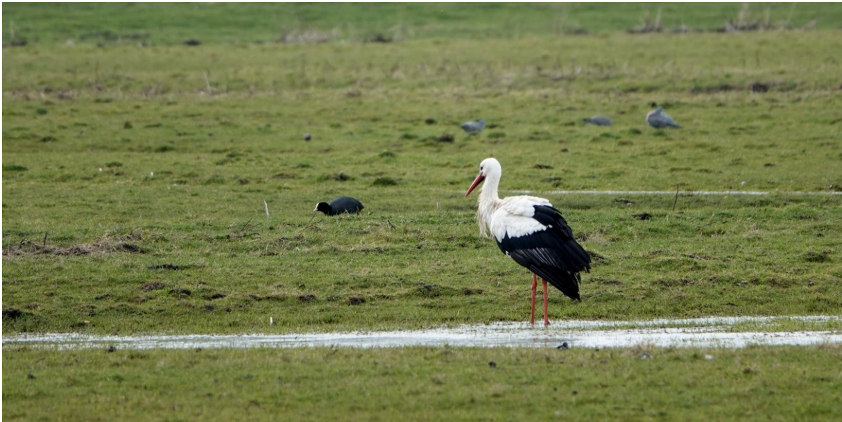
Ooievaar (vrouwetje) van de Kadoelenweg; op de achtergrond Meerkoet en drie Holenduiven (foto: 17 maart 2023)

en de kuikens van weidevogels veelal met rust laten (vanwege de felle verdediging van de kuikens door hun ouders?). We hopen maar dat de Kadoelen-ooievaars kennis hebben van de onderzoeksresultaten.