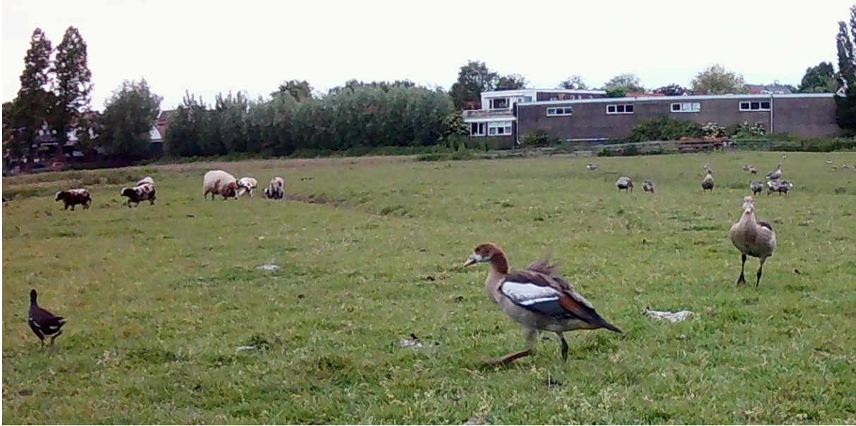
Nijlgans met – op de voorgrond – een groot jong (foto: bewegingscamera, 31 mei 2023)

Er beginnen geleidelijk meer Blauwe Reigers naar de polder (terug) te komen: we tellen er 6 (allemaal adulte vogels, geen jongen van dit jaar). Er loopt ook een enkele Lepelaar langs de slootkant. De Ooievaar van de Kadoelenweg vliegt een rondje boven het weiland en gaat dan weer verder. Het lijkt er overigens steeds meer op dat het Ooievaars-paar geen jongen (meer) heeft.