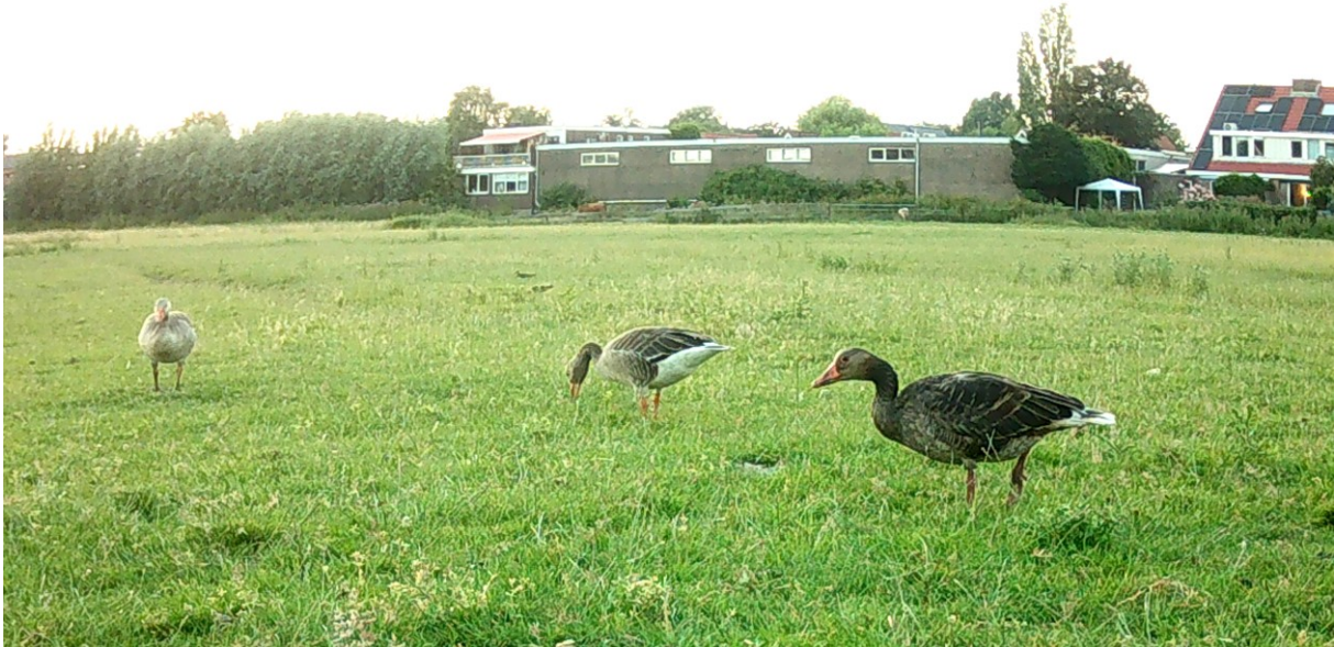
Grauwe Gans; op de voorgrond een donkere vorm (foto: bewegingscamera, 24 juni 2023)

In een ondiepe sloot loopt een Witgatje; hij wordt door een Waterhoen belaagd en besluit om naar een sloot verderop te gaan. Laag boven de weilanden vliegen twee Boerenzwaluwen.