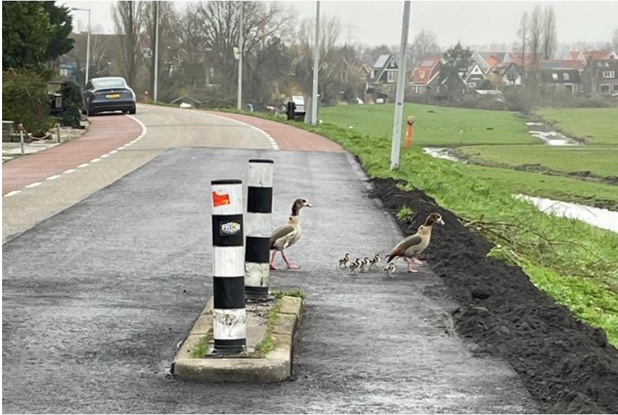
Overstekend Nijlganzenpaar met vijf kuikens (foto: Theone van der Eerden, 22 maart 2023)