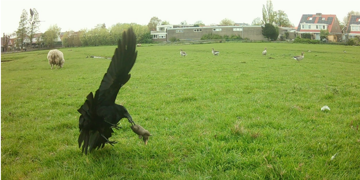
Zwarte Kraai met ganzenkuiken (foto: bewegingscamera 2 mei 2023)

Een bijzonder waarneming vandaag: een Tapuit op perceel 'Gele Weidje'. De Tapuiten komen ieder voorjaar langs op weg naar de broedgebieden langs de kust en op de Waddeneilanden.