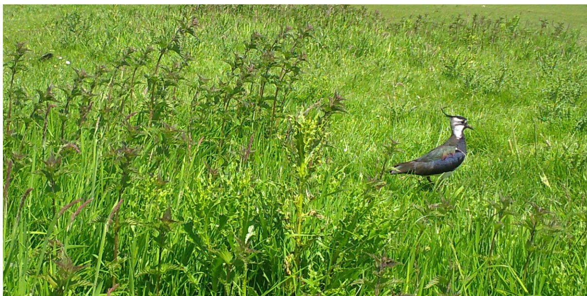
Kievit (foto: bewegingscamera, 19 mei 2023)

Bij de twee Scholekster-paren die met succes gebroed hebben, krijgen we bij elk paar twee grote jongen in beeld. De snavels en poten van de jongen beginnen al een lichtrode kleur te krijgen. Ze worden nog wel gevoerd. Regelmatig strijkt een oudervogel met een wurmpje in de snavel bij ze neer, waar de jongen dan gretig op afduiken.