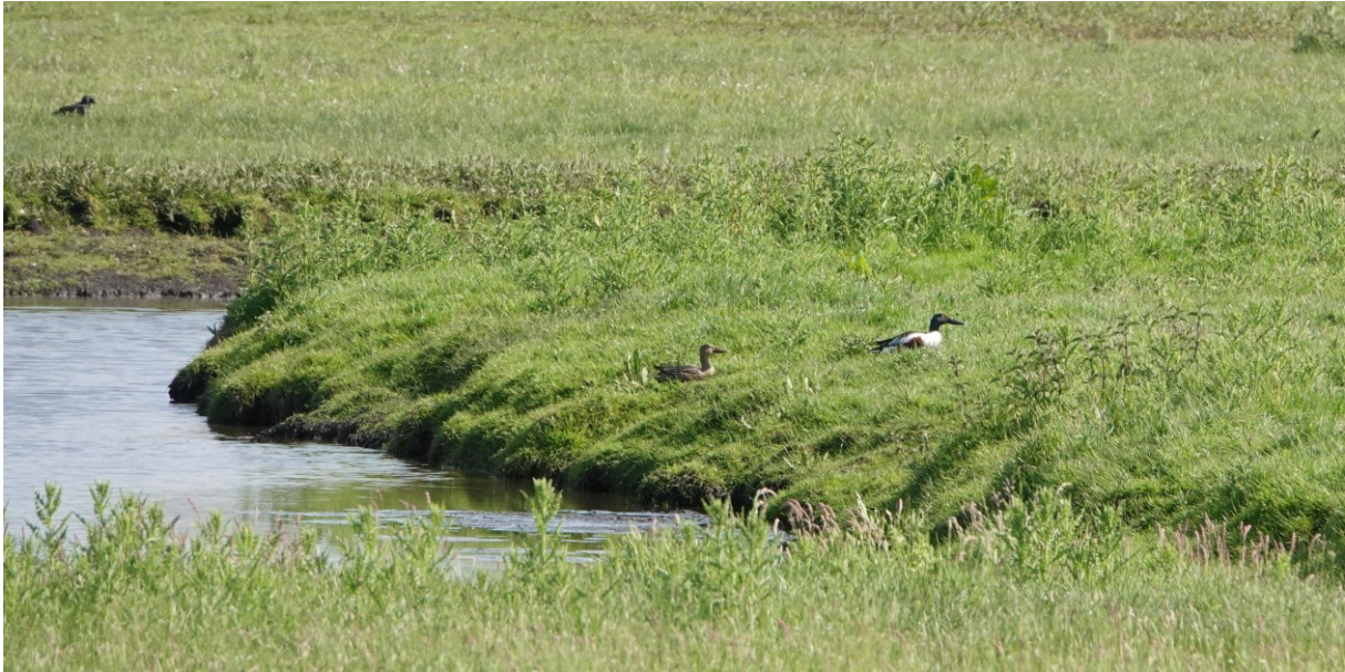
Paartje Slobeend (foto: 22 mei 2023)

Verrassend is dat we vandaag een paartje Slobeenden zien: gaan die alsnog in de polder broeden? Ook verrassend: we zien een Gele Kwikstaart achter de insecten jagen op perceel 'Hofstee'. Deze soort wordt vaker in de polder waargenomen maar de polder is geen vaste zomerverblijfplaats voor de Gele Kwikstaart. Er vliegt ook een Boerenwaluw boven de sloten van de polder. Afgelopen week heeft een Boerenwaluw de paardenstal van een buurtgenoot verkend waar nieuwe gevormde nestkommetjes zijn opgehangen.