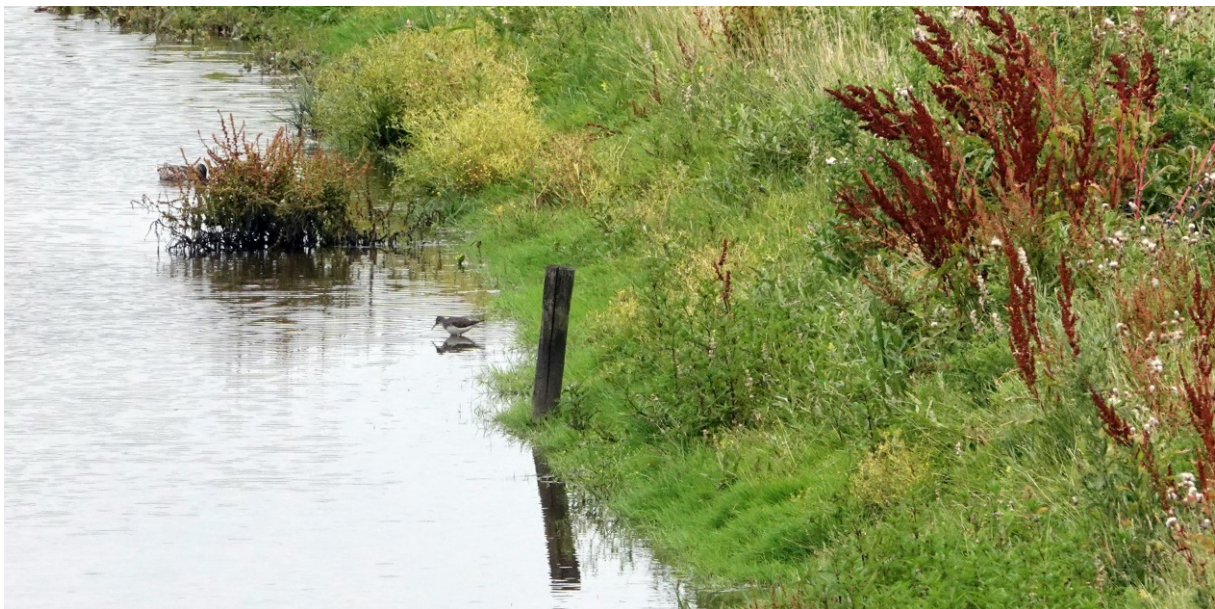
Witgat (foto: 22 juli 2023)