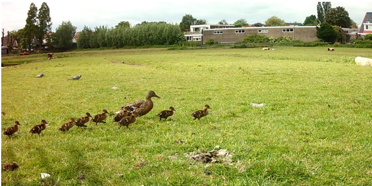
Wilde Eend met 9 kuikens (foto: bewegingscamera, 30 mei 2023)

We krijgen vandaag weer een paar kleine Waterhoen-kuikens in beeld. De Waterhoenen broeden na het teloor gaan van het eerste legsel vaak voor een 2 e keer en soms zelfs voor een 3 e keer. Wat dat betreft lijken ze op de Wilde Eend: we zien vandaag maar liefst 49 kuikens bij verschillende moedereenden, allemaal tussen klein en halfwas en allemaal het resultaat van latere broedpogingen.