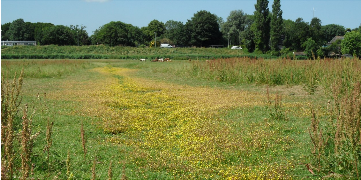
Greppel met Goudknopje (foto: 24 juni 2023)

Duidelijk is te merken dat het weidevogelbroedseizoen ten einde loopt. Er zijn nog enkele adulte Kieviten met opgeschoten, vliegvlugge jongen in de polder. Ook is er één Kievit-paar met kleinere jongen (die nog niet kunnen vliegen en hun voedsel zoeken op drooggevallen delen van de sloot). Op twee plaatsen komen alarmerende Tureluur-stellen boven ons hoofd vliegen: die hebben grote, waarschijnlijk al vliegvlugge jongen. Er zijn geen Grutto's meer; die zijn een tijdje terug met hun jongen vertrokken. Er zijn nog wel enkele Scholeksters in de polder, maar alle jongen van dit jaar kunnen vliegen en bij onraad kunnen die met gemak uitwijken naar Waterland.