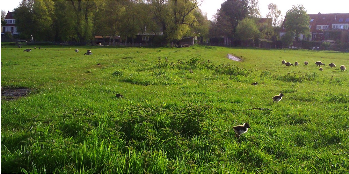
Kievit-kuikens (foto: bewegingscamera, 4 mei 2023)

Vandaag zien we tot onze verrassing een Visdief zitten op een nest op perceel '2 e Molenstuk'. De partner staat dichtbij op een hekpaal. Het gehele voorjaar waren die twee Visdieven al regelmatig te zien boven de sloten van de polder. Kennelijk vinden ze de polder aantrekkelijk genoeg (wat betreft veiligheid en voedselaanbod) om hier een broedpoging te wagen. Het is het eerste broedgeval van deze soort voor de polder.